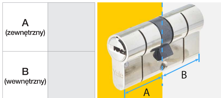
A - ZEWNĘTRZNY B - WEWNĘTRZNY

Przed zakupem zmierz grubość drzwi (rozmiar A i B) przy pomocy miernika i zanotuj wymiary. Upewnij się, że wkładka nie wystaje więcej niż 3 mm poza zewnętrzną rozetę lub szyld.